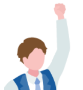
アイデア出し が得意

新しい製品を作るためのアイデアを出しましょう！ ユーザーの声からも、機能性を重視した方が良いと思います！