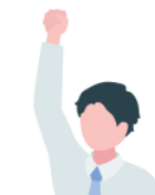
アイデア出し が得意