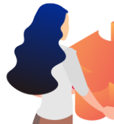
アイデア出し が得意

既存製品の口コミは、機能は◎ですがデザイン性の評価が△。 若者向けにデザイン性の高い製品がいいのではないですか？