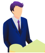
全体像の把握 が得意

異なる視点から考えることができ、議論が発展しやすい。 一方、自分の意見が相手に伝わりにくい場面も多い。