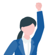
アイデア出し が得意

コミュニケーションはスムーズで、アイデアはたくさん出やすい。 一方、異なる視点からの意見が少なく、議論がまとまりにくい。