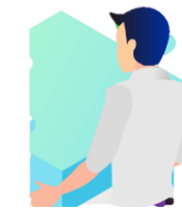
客観的な判断 が得意

では□□の軸で新製品をつくりましょう。 次回のミーティングまでに進捗報告を持ってきてください。