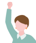
アイデア出し が得意

見た目も一新したいよね。自社だと難しいから、海外の安い デザイン会社に頼んでみたいなと思ってるんだけど。